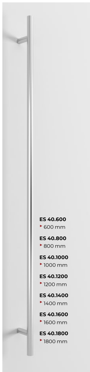
ES 40 Stossgriff Serie ES 40.600-1800 mit geraden Stützen Edelstahl feinmatt poliert