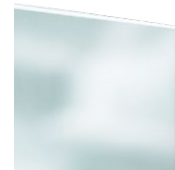
VSG - Sicherheitsglas 1. außen 2. außen und innen