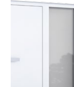
Seitenteil Bis maximal; 800 mm Klarglas / oder Satinato Glas