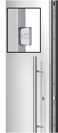
ES 1000 3-fach Sicherheit- Türverriegelung hellverzinkt